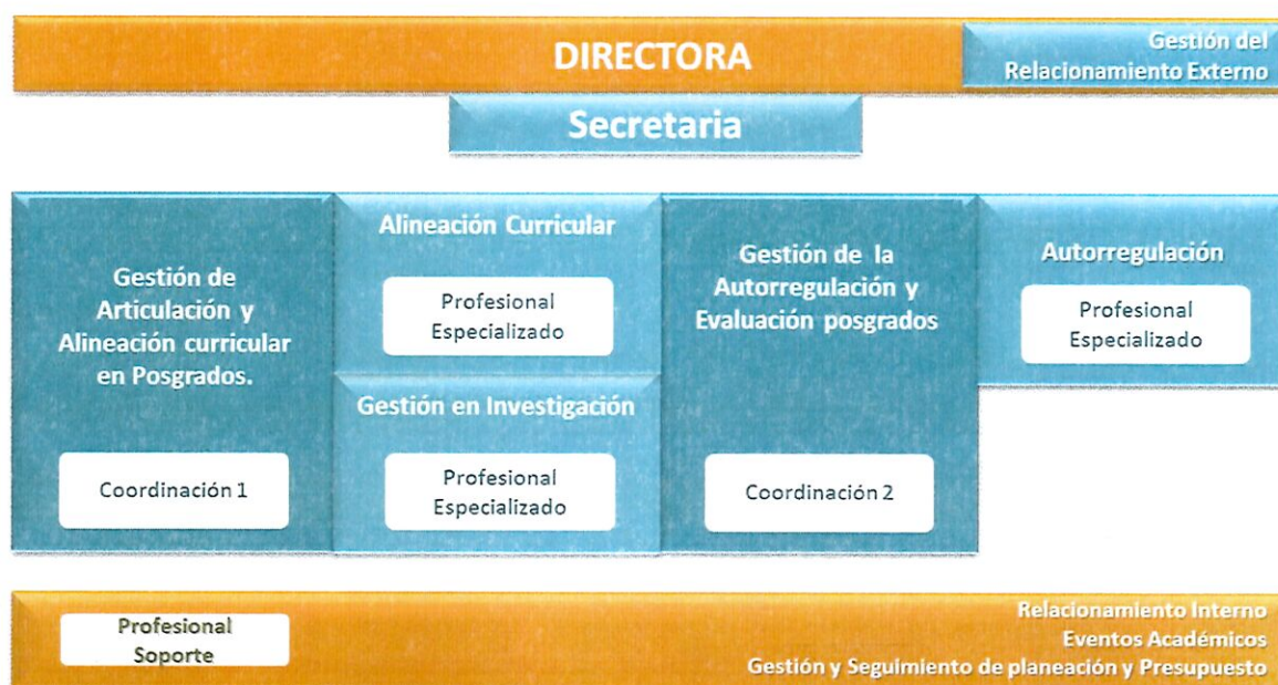
Gráfica 4. Organización de la Unidad de la Sede Principal