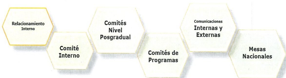
Gráfica 3. Relacionamento Interno (2)